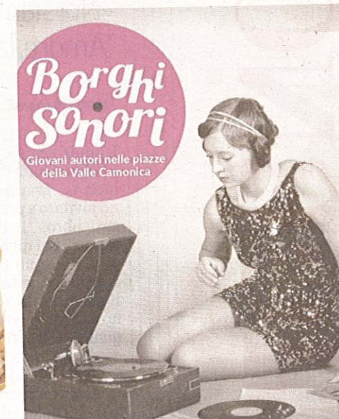
Locandina di Borghi Sonori (fino al 9 settembre)