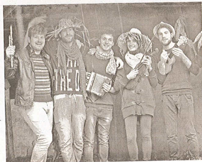
In cartellone il 31 agosto a Esine il folk degli ArtyCiòk