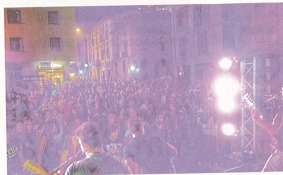
Impazza in valle il rock degli Jena da Breno a Losine, dove hanno suonato giovedì per «Borghi Sonori»

Finale affidato all'esperienza di West Fargo, con un solido hard rock targato Usa che il 9 settembre farà vibrare il Giardino delle Primavere di Ceto e chiuderà questa rassegna che già pensa alla prossima edizione di talenti. •