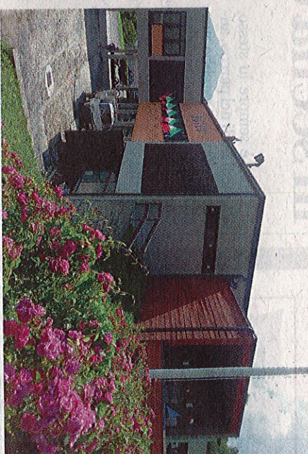
Il Museo della Resistenza in Valsavio

che si svilupperà principalmente nella pineta.