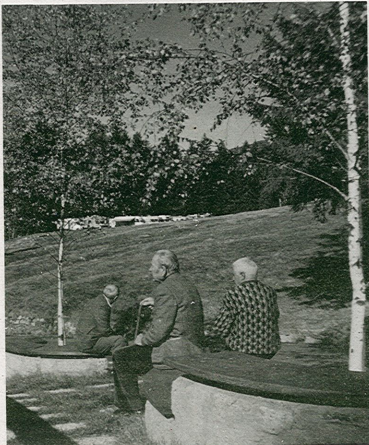
Angolo della pineta