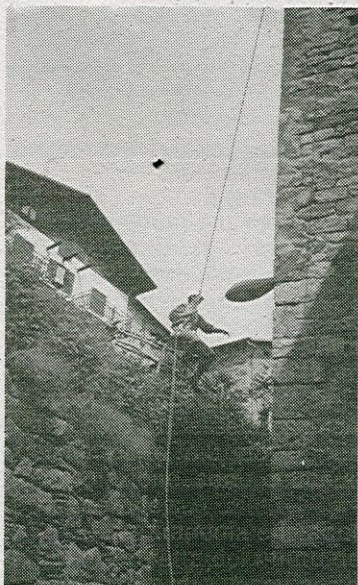
Estate '89: arrampicata sul campanile

Ringraziamo tutti coloro che hanno partecipato alle nostre iniziative e speriamo di ottenere anche nel futuro un così vasto consenso per la nostra attività.