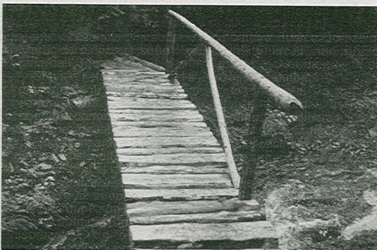
Sentiero 113: il nuovo ponte sulla valle del Coppo