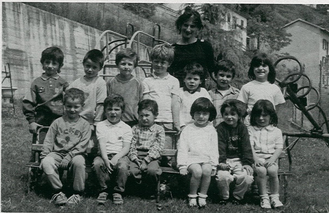
Anno scolastico '88/89 - Gruppo bambini della scuola materna di Cevo

Alla popolazione, che ha partecipato in modo notevole, con grande disponibilità, e a chi ci ha accolti con affetto e simpatia. All'amministrazione comunale, che ha considerato lo studio come momento essenziale della propria politica