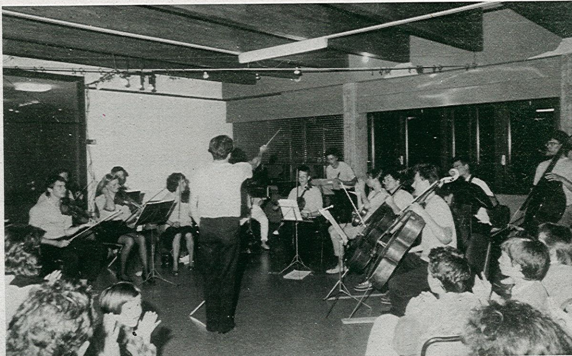
14 agosto '89: l'orchestra classica "Coda" di Amsterdam in concerto presso la scuola elementare. Per Cevo un'esperienza nuova ed entusiasmante