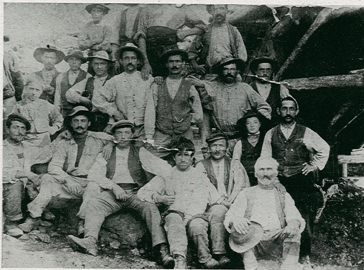
Costruttori del vecchio Ponte sul Torrente Igna (1910-11)