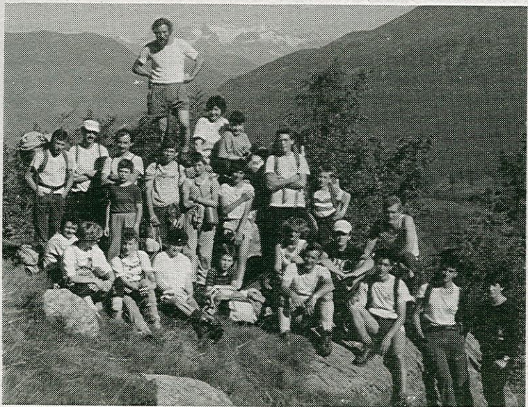
Gita in Val di Fumo

per evitare ai cittadini una sensibile maggior spesa nella fruizione di questi specifici e indispensabili servizi.