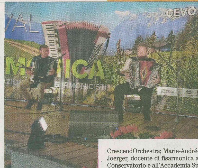
FISCARMONICISTI A CEVO

Il Concorso. Il Concorso è aperto a tutti i fisarmonicisti di ambo i sessi e di ogni nazionalità con lo scopo di promuovere la cultura musicale e valorizzare i giovani musicisti; questi ultimi sosterranno le audizioni - divisi in apposite categorie sulla base dell'età e della scelta del repertorio (musica classica o