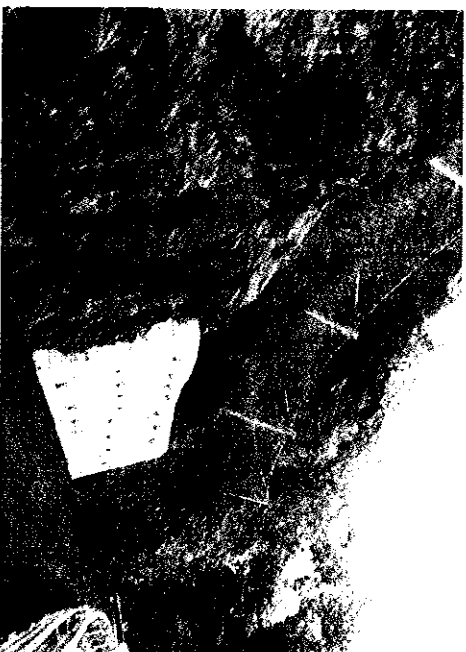
Un tratto della provinciale 84 protetto da reti e muri

Così si è lavorato a soluzione definitiva, e proprio grazie agli ormai ex fondi Odi il sindaco ha ottenuto il finanziamento necessario, oltre altri 400 mila euro stanziati dalla Provincia dopo un accordo di programma. Sono trascorsi quasi sei anni dall'assegnazione dei contributi e in questa lunga parentesi si è arrivati alla conclusio-