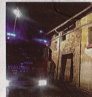
Il 52enne è morto nel rogo