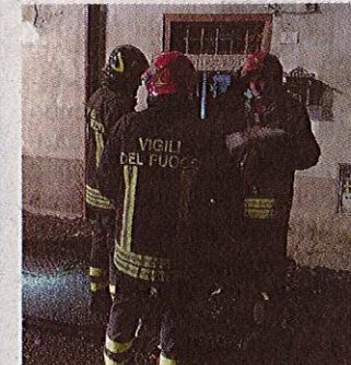
I Vigili del fuoco all'opera