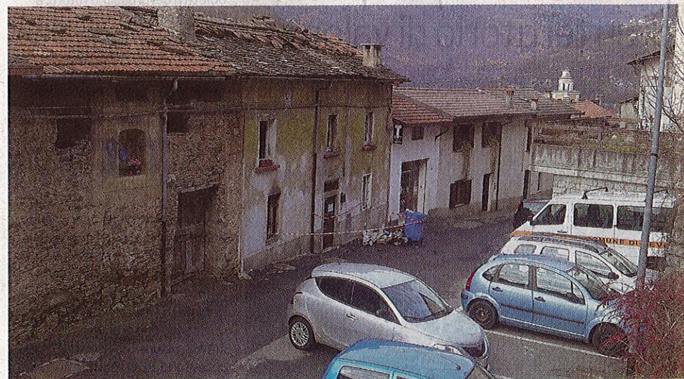
L'abitazione della frazione di Cevo è stata messa sotto sequestro dall'autorità giudiziaria