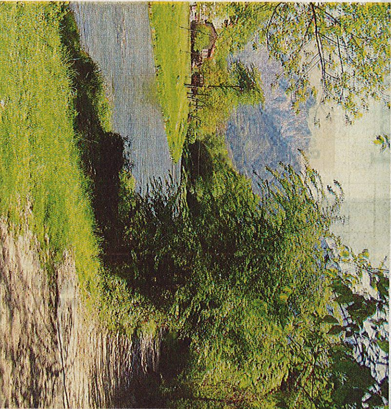
Lungo il fiume. Significativi investimenti riguardano l'Oglio