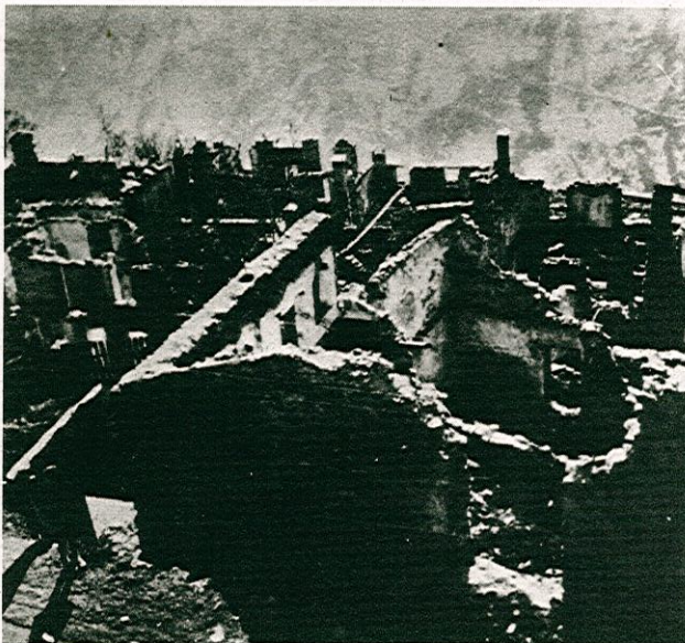
Luglio 1944: Cevo il giorno successivo alla rappresaglia nazi-fascista