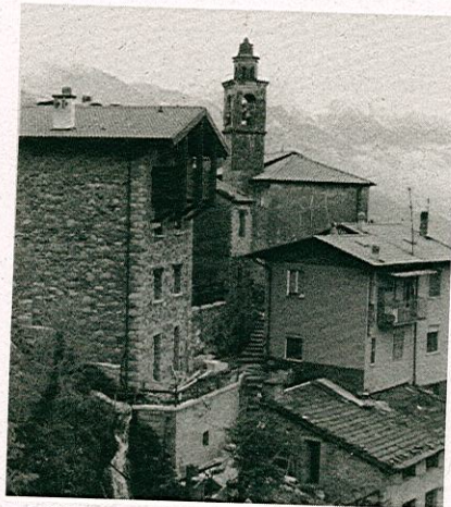
Andrista: un caratteristico scorcio del centro storico