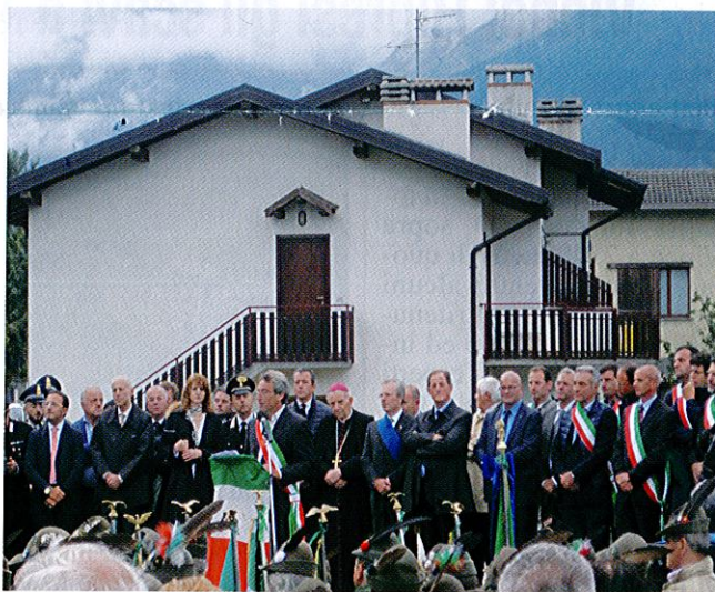
Cevo: Il saluto del sindaco attorniato dalle numerose autorità della Regione, della Provincia e della Valle.