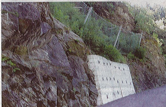
Entrano nel vivo i lavori di messa in sicurezza sulla provinciale 84

A suo tempo vennero posate reti paramassi e solidi ripari in calcestruzzo a tutela del sito ma rimaneva comunque la pericolosità di Valzel. Dal finanziamento del 2013 si sono succedute varie vicende,